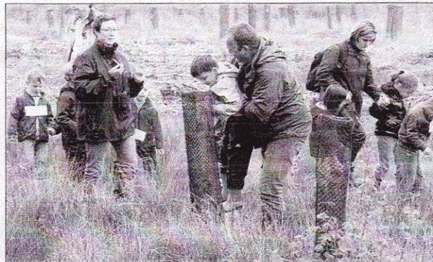
Les élèves sont revenus voir les merisiers qu'ils avaient plantés en décembre 2011, chacun a pu retrouver son arbre grâce aux étiquettes.