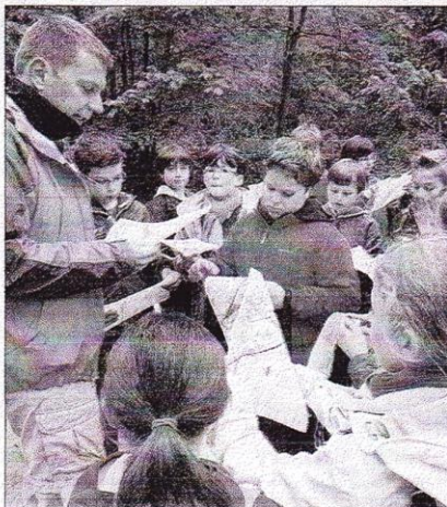
Pas simple de se repérer sur une carte, la course d'orientation prenait d'ailleurs des allures de parcours du combattant à cause de la boue.